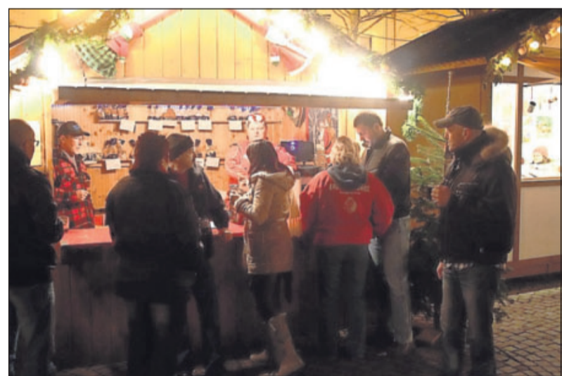
Betriebswirtschaftlich waren die beiden Weihnachtsmarktwochen nicht der Bringer – auch wegen der vielen Regen- und Sturmtage. Glühwein wurde aber gerne getrunken.

Eine solche nächtliche Heimsuchung ist nach Einschätzung der Organisatorin schwer zu verhindern. „Was hier an Nachtwache geleistet werden kann, kommt von den Besuchern selbst. Für eine richtiggehende Security fehlt uns schlicht und ergreifend das Geld.“ Nach Anga-