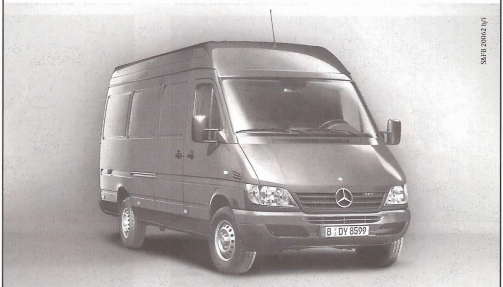
Der Mitarbeiter des Monats.

in Star Trek eine wissenschaftliche Grundlage haben und früher oder später Wirklichkeit werden können. Es wurde Stand-up-Comedy geboten und ein 2,5 Megawatt-Laser aufgeföhren, Storm-Troopers tauchten im Publikum auf, es wurde mit Schwertern und mit Stöcken, Fäusten und Füßen auf der Bühne gekämpft und selbst Prinzessin Ammidala vom Planeten Naboo schenkte der Veranstaltung ihren Glanz. Dazu gab es Antarianisches Leuchtwasser, Klingonischen Blutwein, Förderationsbrezeln und Gagh (sprich Gach), eine klingonische Spezialität, die aussieht wie lebende Würmer... Alles in allem eine prächtige Show, die die über 20 Aktiven rund um Dr. Zitt auf die Beinen gestellt haben. Freuen wir uns schon aufs nächste Jahr, wenn es dann zu dieser Zeit heißen wird: „Star Wars – Philosophie, Sprache, Technik“.x