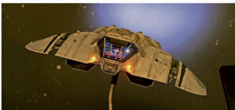
Fans zeigten, wie toll sie Raumschiffe in klein nachbauen können, hier eines aus „Kampfstern Galactica“.