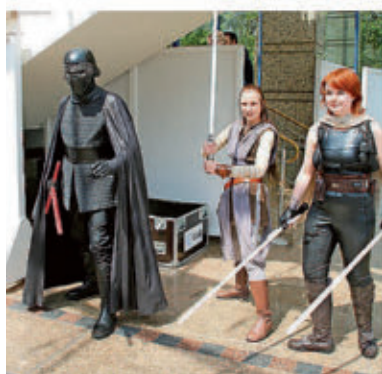
Lichtschwert-schwingende Fans in „Star Wars“-Kostümen