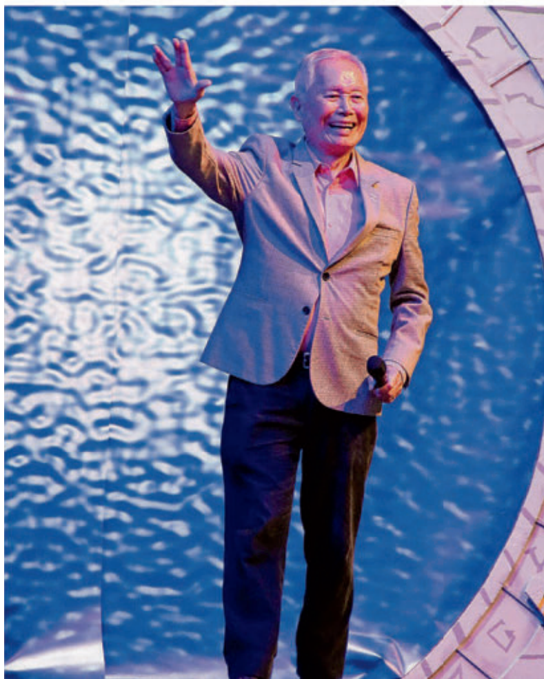
Der 86-jährige George Takei („Mr. Sulu“) ist einer von ganz wenigen noch lebenden Schauspielern der Original-Star-Trek-Serie. Er wurde besonders lautstark gefeiert.