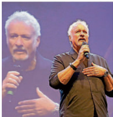
John de Lancie („Q“) zählt auch zu den Fanlieblingen.